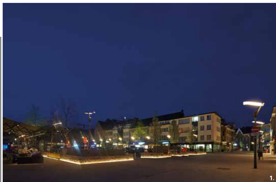
foto 1 : De Fruitmarkt kreeg aangepaste verlichting. Zelfs de muurtjes die dienst doen als zitbanken zijn uitgerust met leds.

Niet alleen beton siert de Fruitmarkt, ook Chinese hardsteen (maten 20/13 en 40/40) die de vroegere